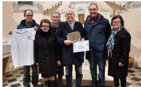
SAINT GOR Jean LOUBÈRE Annick Tastet