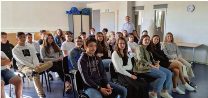
COLLÈGE DE SAINT MARTIN DE SEIGNANX