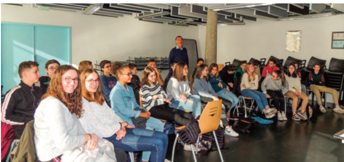
COLLÈGE DE MONFORT

Votre comité en est à sa 17 ème année de conférences visant à sensibiliser les élèves notamment de 3 o aux méfaits sus cités.